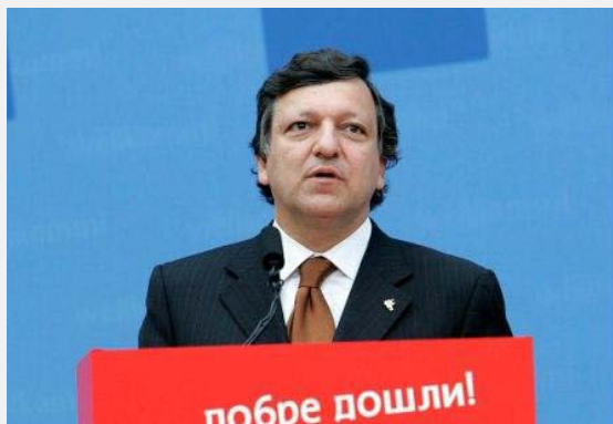
Svečani govor Hose Manuel Barosa prilikom potpisivanja ugovora o pristupanju Bugarske i Rumunije.

Proces proširenja zasnovan je na određenom broju principa i instrumenata, koji su razvijani postepeno, naročito povodom petog proširenja. Oni treba da pripreme zemlje kandidate da preuzmu obaveze koje proizilaze iz statusa države članice. Kriterijumi iz Kopenhagena određuju uslove koje zemlje kandidati treba da poštuju: politički i ekonomski kriterijumi i usvajanje i primena evropskog zakonodavstva (acquis). Ovaj proces zahteva od zemalja kandidata da ulože veliki napor, posebno u oblasti jačanja institucija i reformama koje treba da sprovedu u svojim državama. Evropska unija je zato formulisala različite instrumente za podršku i pomoć tim državama, kao i instrumente kojima bi procenila njihovu pripremu, kao i potrebe u svakoj fazi procesa proširenja.