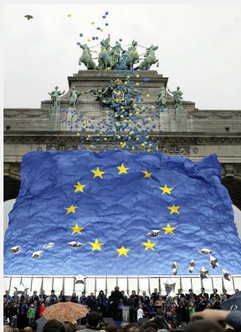
Proslava „Istočnog“ proširenja EU ispred Brandenburške kapije

Evropska unija predstavlja uspešan model jedne bezbednosne zajednice i kao takva doprinosi održavanju mira i jačanju međunarodne bezbednosti.