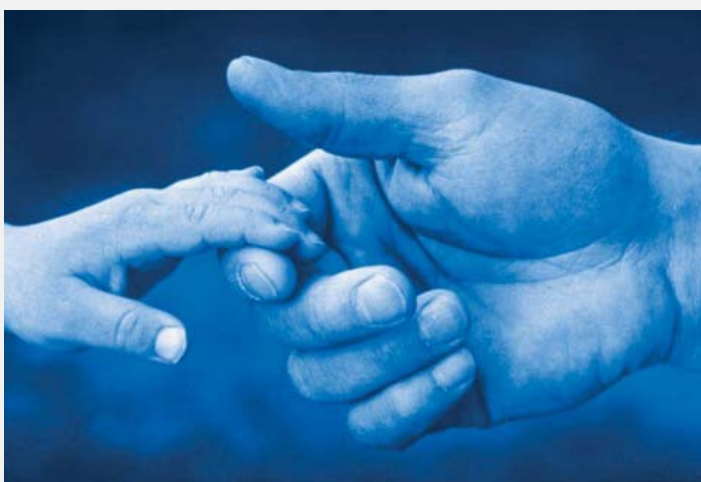
Slika sa sajta švedskog predsedavanja EU 2009. godine Photo: Lisa Tanner/Pixgallery

Evropska unija je, počev od 1999. godine, ustanovila praksu po kojoj se na svakih pet godina formulišu prog-rami saradnje u oblasti pravosuđa i unutrašnjih poslova država