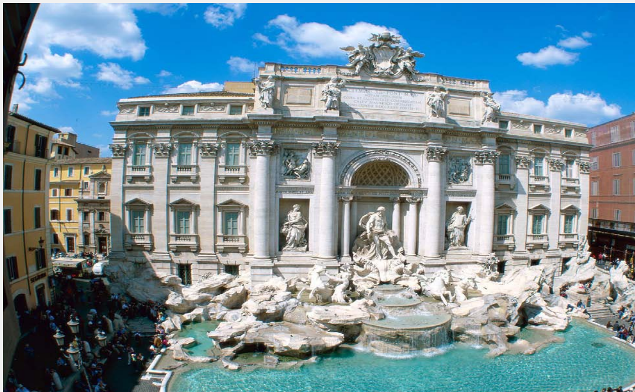
Fontana Di Trevi u Rimu

Države članice Evropske zajednice (EZ), tačnije ministri unutrašnjih poslova su počeli neformalno da se okupljaju već nakon tri godine od pomenutog događaja. U decembru 1975. godine Evropski savet formirao je tzv. Trevi grupu kako bi koordinisao rad vlada država članica EZ u borbi protiv terorizma.