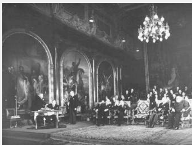
Potpisivanje Briselskog sporazuma iz 1948. o osnivanju WEU

Začetak spoljne i bezbednosne politike EU predstavlja formiranje Evropske političke saradnje – EPS (European Political Cooperation – EPC), koja je od 1970. godine, pa do Mastrihta predstavljala sistem saradnje i usaglašavanja stavova država članica u oblasti spoljne politike. Bilo je pokušaja da ovaj koncept bude proširen i na oblast odbrane i bezbednosne politike, ali su se tome suprotstavile Velika Britanija, Irska i Danska. Ova politika je često kritikovana kao isuviše reaktivna. U slučaju sovjetske invazije na Avganistan i tokom raspada SFRJ ona se pokazala i kao neefikasna i nekonzistentna.