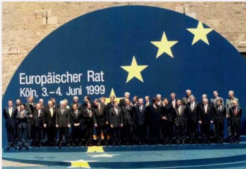
Samit EU u Kelnu 1999. godine

(izvođenje operacija razoružanja, pružanje podrške trećim zemljama u borbi protiv terorizma i reformisanja sektora bezbednosti).